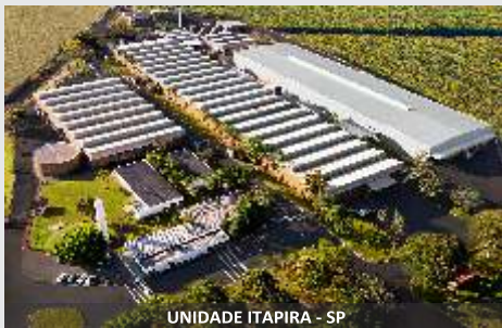
UNIDADE ITAPIRA - SP

Distribuidores de fertilizantes, sementes e calcário. Cobrando sua terra com produtividade!