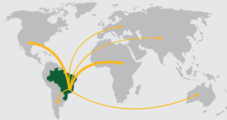
DO BRASIL PARA MAIS DE 50 PAÍSES