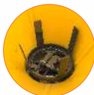
Agitador de 4 pontas com movimento oscilante