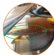
Regulagem de saída

Descritivo técnico: Distribuidor e semeadeira pendular com capacidade para 600 litros, tratorizado, estrutura em aço, reservatório em polietileno, equipado com unidade pendular independente, pêndulo em fibra de nylon, alcance de lançamento de 9 a 14 metros, sistema agitador com movimento oscilantes, agitador com cone em fibra de nylon, agitador extra para diferentes produtos, controle de dosagem através de regulagem do registro de saída, acionamento por cardan, barra dosadora, alavanca da barra dosadora, potencia requerida na TDP de 50 cv e rotação requerida na TDP de 540 RPM.